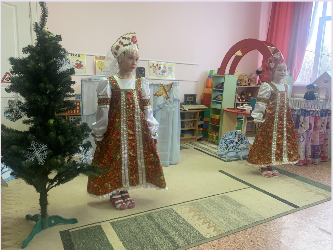
Группа № 7 «Солнышко» Экологическая сказка «Происшествие в лесу»