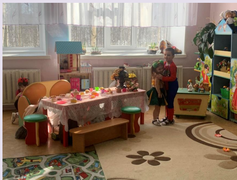
Группа № 9 «Радуга» Сказка «Волк и семеро козлят»